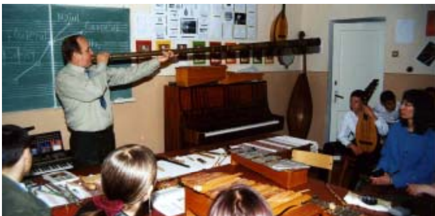
La o oară de organobgie