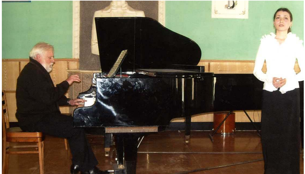
Concurs Can to academic