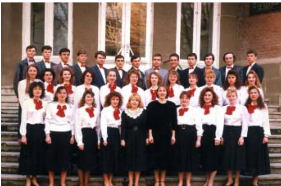
Coorul ARS NOVA