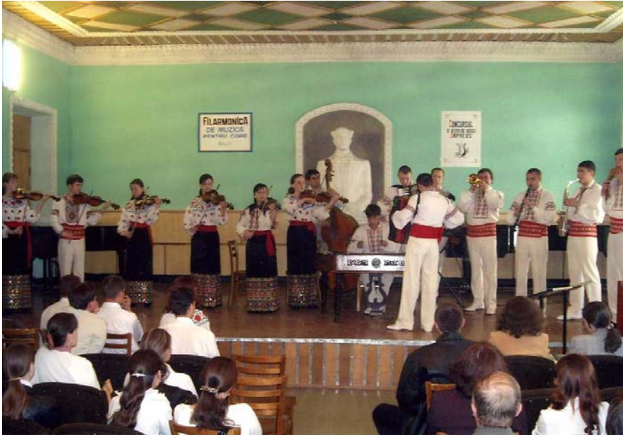
Orchestra de muzică populară „A lunelul”