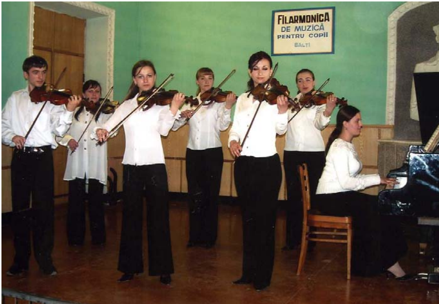
Ansamblul de violoniști