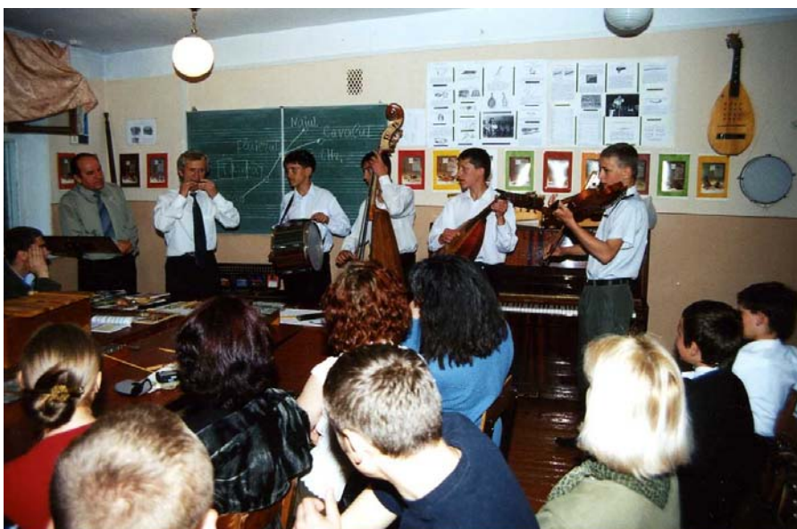
Oră practică cu elevii școlii de muzică „Ciprian Porumbescu”