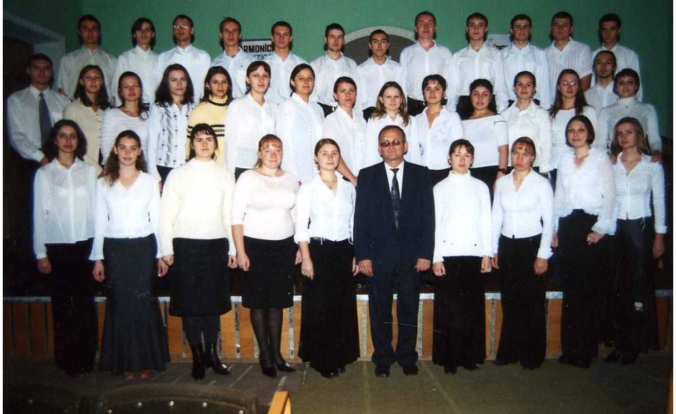
Co ru l facultății Muzică și Pedagog ie muzicală