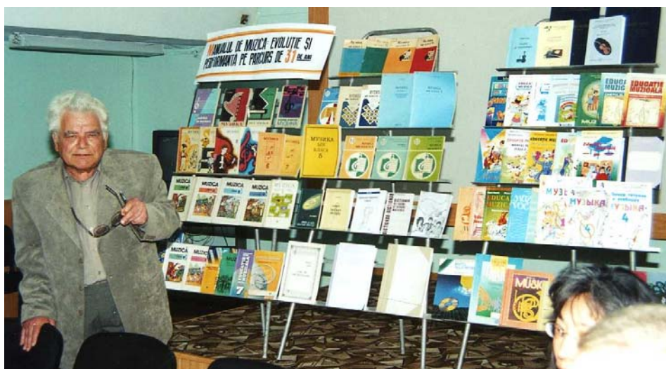
Manualul școlar de muzică – 30 de ani