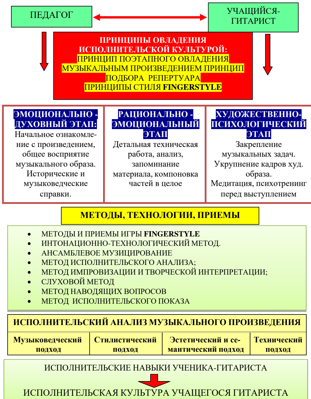
Риунок 1. Педагогическая модель

В рамках методологического исследования мы разработали Педагогическую модель работы над музыкальным произведением в классе гитары основанную на методике fingerstyle на начальном этапе обучения гитаре.