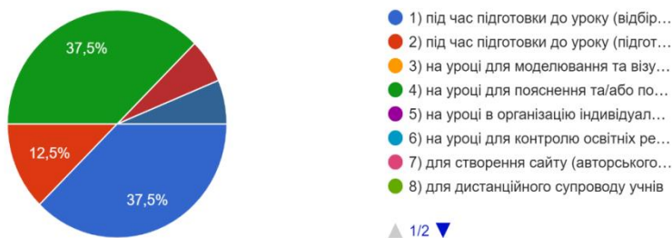
Діаграма 2. «Як Ви використовуєте інформаційно-комунікаційні технології у професійній діяльності?»

Згідно з результатами опитування інформаційно-комунікаційні технології використовуються на уроках для пояснення та/або повторення (узагальнення) матеріалу (мультимедійна презентація) і під час підготовки до уроку (відбір навчального матеріалу: картки, завдання, тексти; електронних освітніх ресурсів) (Діаграма 2). Це свідчить про те, що інформаційно-комунікаційні технології використовуються на уроках різного типу та про доцільність використання ІКТ на уроках «формування здібностей добування знань» завдяки тому, що за допомогою яскравих ілюстрацій, відеороликів та звукового супроводу легше утримати увагу учнів, та на уроках закріплення матеріалів, що дає змогу зацікавити кожного до роботи чи то індивідуально, чи то в групі та отримати кращі результати від навчання.