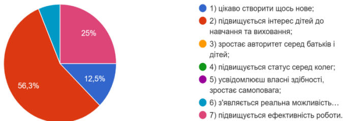
Діаграма 1. «Чим Вас приваблює використання інформаційно-комунікаційних технологій на уроках?»