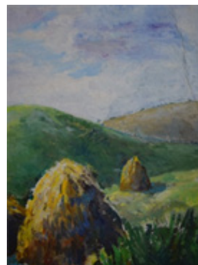
[Vara] : Pictură pe carton