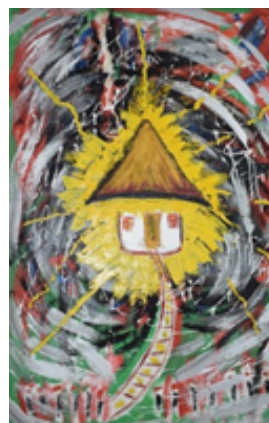
Clopotul Acasei: Pictură pe pânză, guași

Anul 2010. Într-o activitate organizată de Liceul Teoretic Republican „Ion Creangă” în incinta Bibliotecii este invitat Iulian Filip , poet, scriitor, dramaturg și folclorist român, pictor, inventator, cercetător din Republica Moldova, doctor în filologie. Este organizată expoziția de pictură și grafică a lui Iulian Filip „Crucile, cumpenele, merele și Acasele Iuliene”, Iulian Filip donează Bibliotecii Științifice tabloul pictat în anul 2005 - Clopotul Acasei : guași. „Pictura mea, cât și poezia mea, spune Iulian Filip, sunt indispensabil legate de casa părintească. Aici este accentuat simbolismul, expresionismul și coloristica picturii prin tehnica liniilor, punctelor și a altor insemne ce-l caracterizează pe autor, prin ele, dând astfel greutate mesajului.” [10]