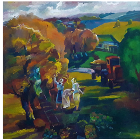
Vieru, Igor. [Amează de vară], [La culesul merelor]. Pictură în ulei pe pânză, color.