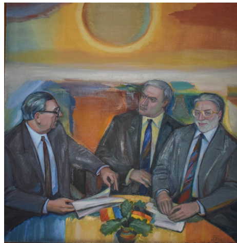
Florescu, Ștefan. Portret de grup. Pictură în ulei pe pânză