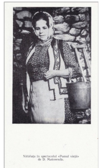
Nătălăța în spectacolul «Pomul viergii» de D. Matcovschi.