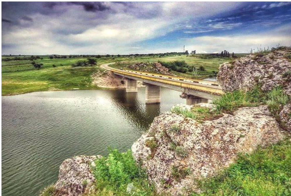
Fig. 2. Podul peste râul Ciugur de la intrarea în satul Văratice

La edificarea tuturor instituțiilor importante ca școala, grădinița și biserica s-a ținut cont și de amplasarea geografică în raport cu localitatea, astfel, acestea se află în mijlocul satului. După aceleași criterii atestăm și Liceul Teoretic Văratice care este situat în centrul satului. Văraticele, care actualmente are o populație de 2228 de locuitori, a reușit ca în atmosfera unei priveliști pitorești, împletită cu obiceiuri și tradiții frumoase, să transmită din generație în generație, prin intermediul profesorilor, nu doar știința de carte, dar și valorile spirituale ale locului.