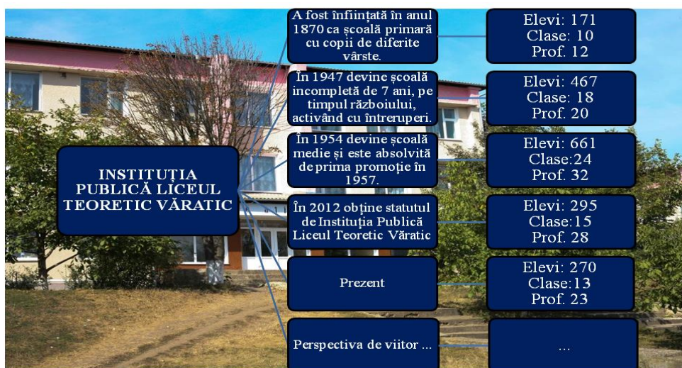
Fig. 3. Evoluția în timp a LT Văratice