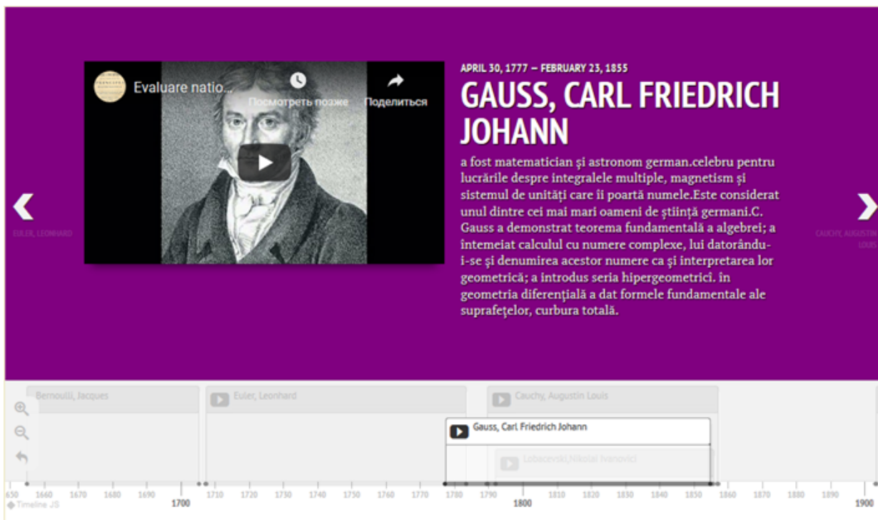
Figura 1. Scara timpului realizată în TimeLine JS.