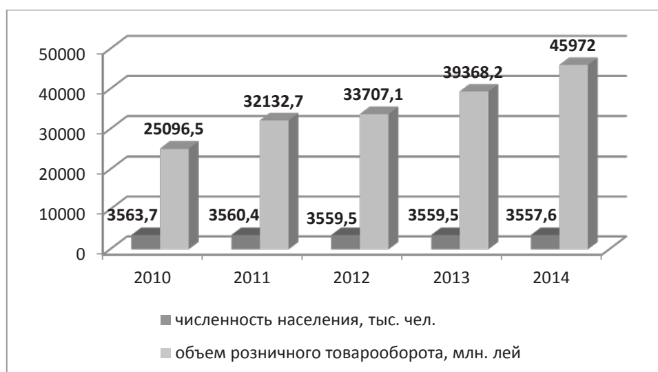
Рис. 4. Соотношение динамики розничного товарооборота и численности населения