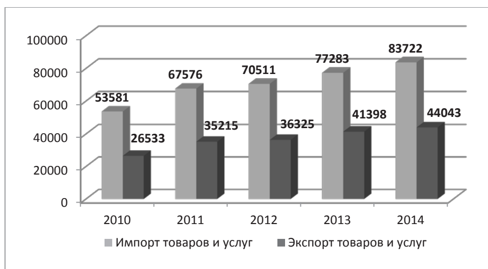
Рис. 1. Импорт и экспорт товаров и услуг (млн. лей)

Изложение основного материала исследования. В общем смысле экономическая подсистема характеризует народное хозяйство страны и включает в себя совокупность производств,