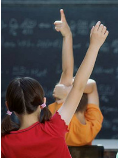
fig.1 Metode nu doar pentru școală.

Metodele de învățământ sunt căile folosite în vederea transferării, fixării, sistematizării și evaluării cunoștințelor elevilor.