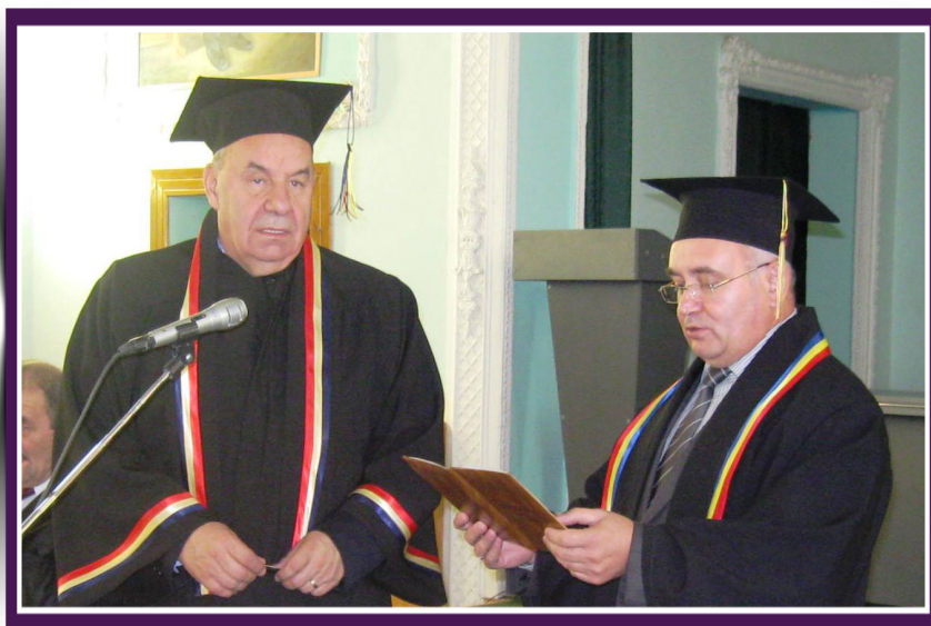
2010. Andrei MARGA