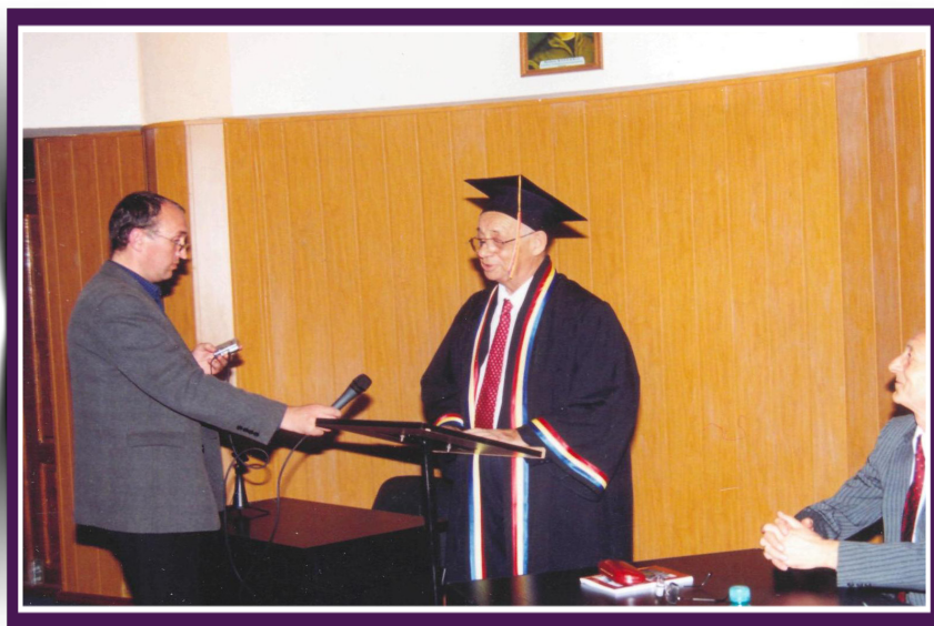
2003. Israil GOHBERG