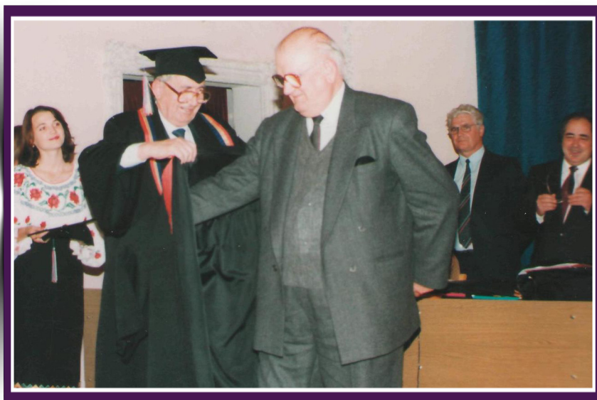
1998. Eugeniu COȘERIU