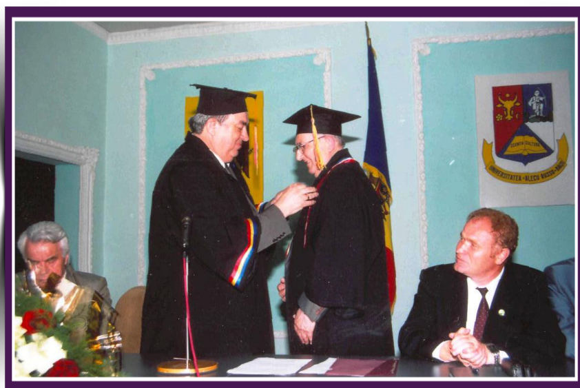
2006. Gheorghe DUCA