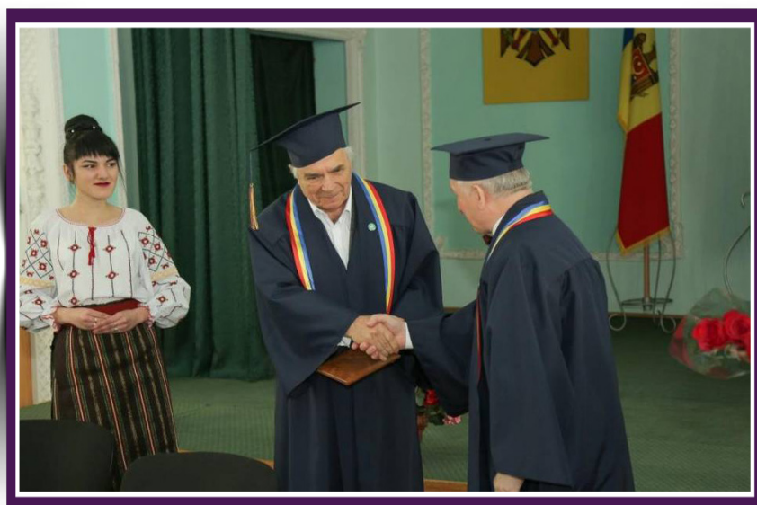
2017. Nicolae MANOLESCU