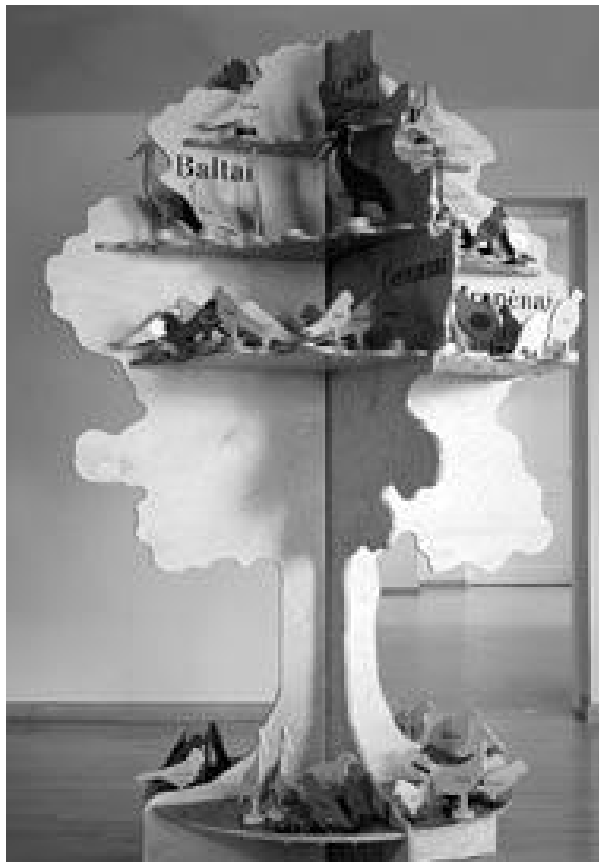
Muzeul limbii. Arborele limbilor.

Cea mai curioasă parte a expoziției Muzeului sînt jucăriile lingvistice interactive. Ideea acestei expoziții este simplă și complicată în același timp: vizitatorilor li se propune să intre în contact direct cu lingvisticul și să cunoască despre acest domeniu