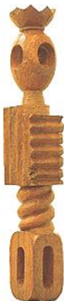
Constantin Brâncuși. Regele regilor