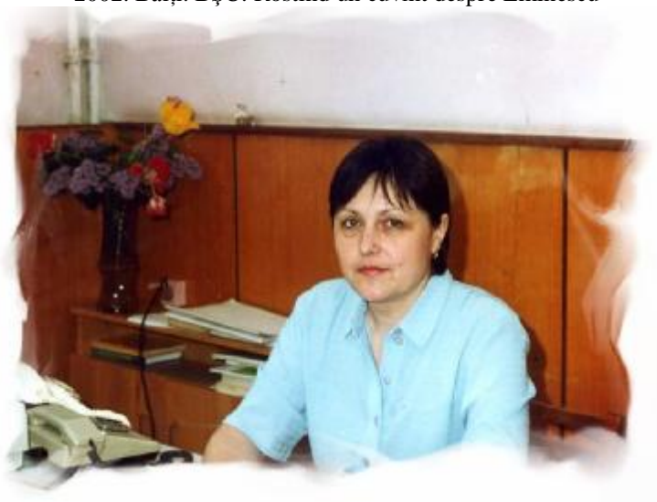
2002. Bălți. În biroul decanului Facultății de Filologie