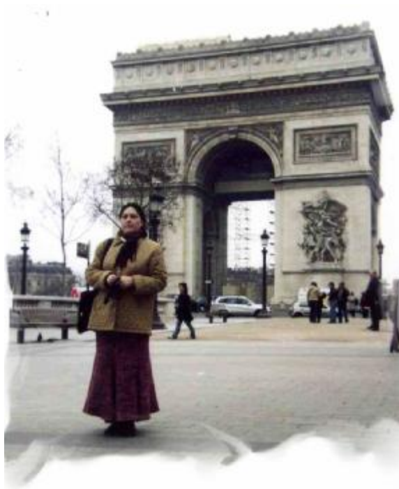
2004. Paris. Les Champs Elysée