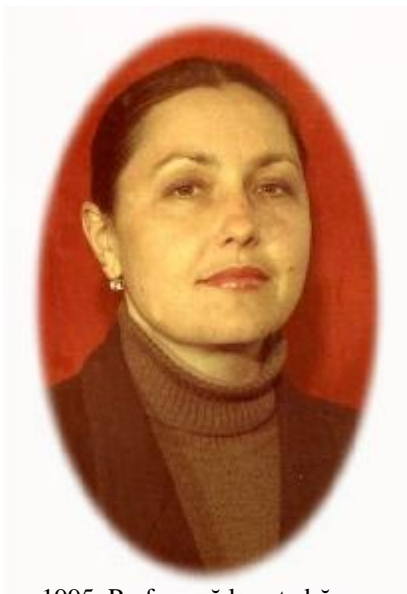
1995. Profesoară la catedră