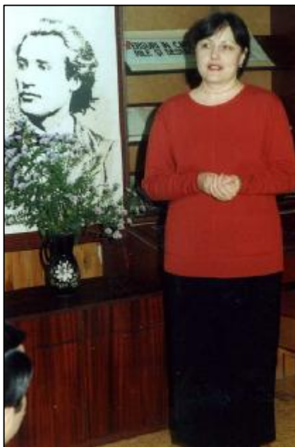
2002. Bălți. BȘU. Rostind un cuvînt despre Eminescu