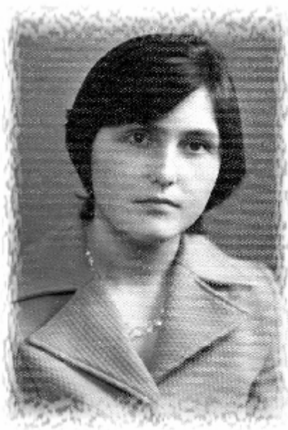
1978. Studentă la anul II