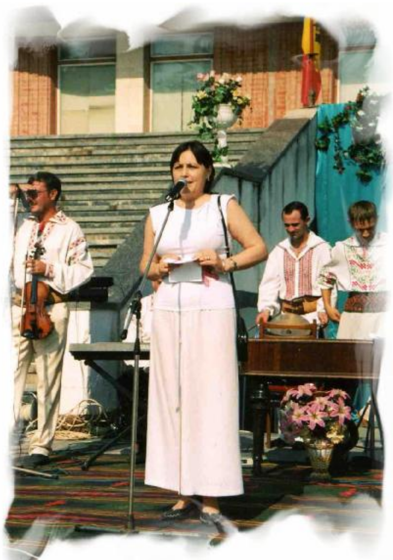
2004. Bălți. Sărbătoarea „Limba noastră cea română”