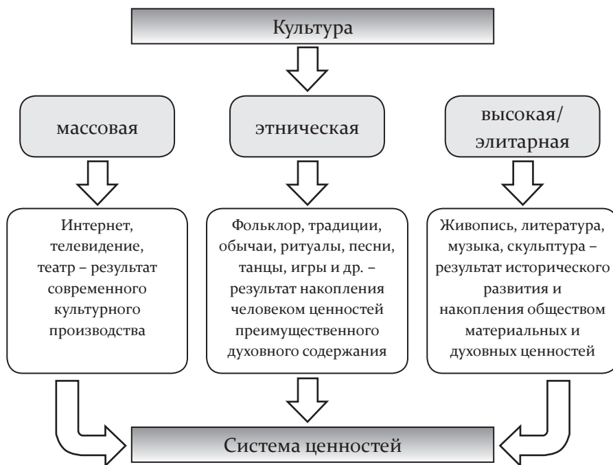
Рис. 1. Формы и содержание общей культуры

Этническая культура также представляет свод ценностей, значимых для народа, как говорилось ранее. Для конкретизации и детального рассмотрения компонентов этнической культуры, представляющих систему ценностей, следует определить к какой форме, направленности относится этническая культура. Таким образом, анализ и синтез содержания понятия культура позволил нам обозначить такие типы и формы культуры, как: массовая, народная/этническая, высокая.