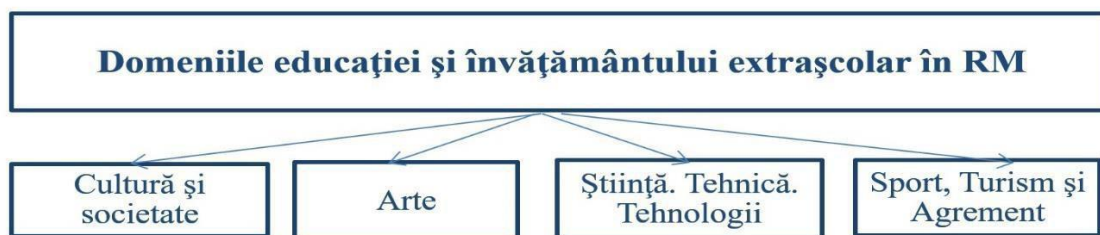
Figura 1. Domeniile educației și învățământului extrașcolar în Republica Moldova

Pornind de la conceptul și specificul caracteristicilor educației extrașcolare, dar și de la opțiunile conținutale și metodologice de realizare a acestui proces s-a conturat structura educației și învățământului extrașcolar [2, p. 18], care este constituită din domenii, profiluri și tipuri de activități specifice /discipline (Figura 1):