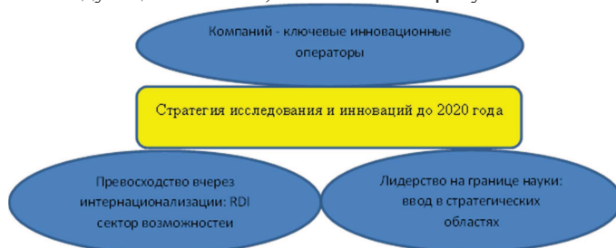
Рис. 3 Суть стратегий исследования и инноваций до 2020 года

Стратегия исследования и инноваций до 2020 года, в Молдове фокусируется на следующих аспектах, показанных на рисунке ниже.