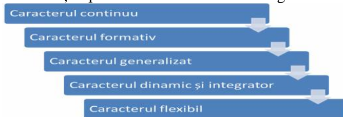
Figura nr. 2 Caracteristicile educației permanente

Caracteristicile educației permanente sunt redată în Figura nr. 2.