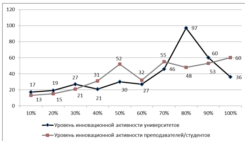
Рис. 3. Соотношение уровней инновационной активности университетов и преподавателей/студентов (оценка респондентов)

Сравнивая уровень инвестиционной активности в целом по молдавским университетам и преподавателей со студентами в отдельности, можно констатировать, что эти показатели существенно отличаются (рис.3).