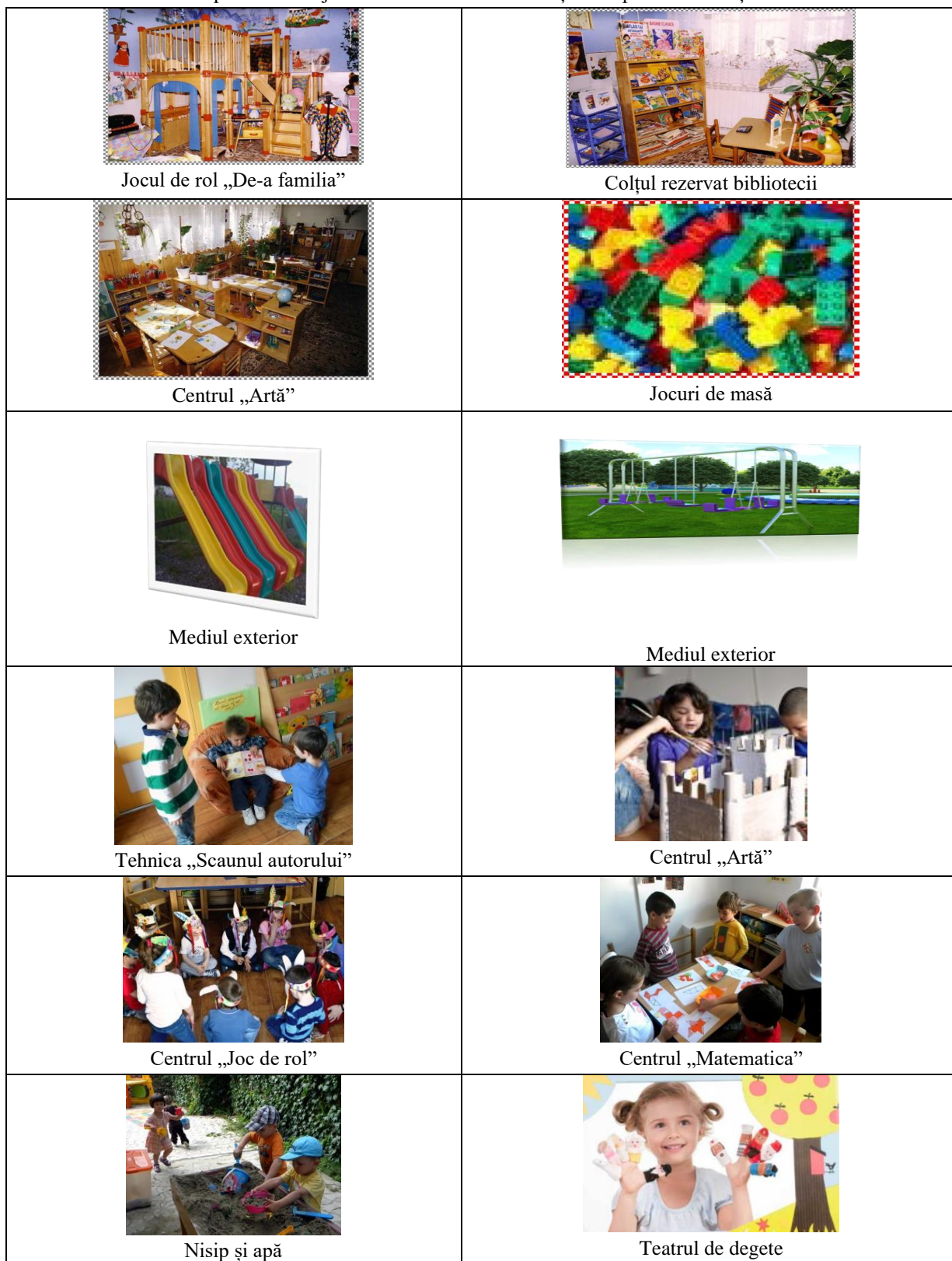
Tabelul 1. Exemple de amenajare a centrelor de activitate și exemple de activități în centrele de activitate

Concluzii: stabilirea fundamentelor teoretice ale potențialului formativ pe care îl are mediul educațional stimulat prezintă o provocare continuă pentru cadrele didactice din instituțiile de educație timpurie; mediul educațional având un rol hotărâtor în formarea