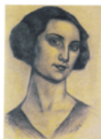
Portretul lui I. Teodorescu-Sion realizat de Alexandru Plămădeală în anul 1934.

Al. Plămădeală a fost inițiatorul lansării în Chișinău al unui muzeu în aer liber, ansamblul sculptural Aleea clasicilor literaturii române , amplasat în grădina publică a capitalei. Mai mult, artistul avea elaborate câteva busturi care urmau să inaugureze viitoarea alee: cel al enciclopedistului B. P. Hasdeu, al poetului preot Alexee Mateevici, prietenul din tinerețe al lui Al. Plămădeală și bustul fabulistului Alexandru Donici. Capodopera lui Alexandru Plămădeală o constituie Monumentul lui Ștefan cel Mare din Grădina Publică cu același nume din Chișinău (1927).