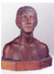
Bustul lui I. Teodorescu-Sion realizat de Alexandru Plămădeală în anul 1934.