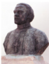
Bustul lui Alexee Mateevici realizat de Alexandru Plămădeală în anul 1934.