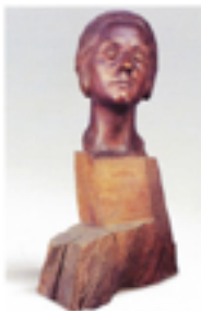
Bustul lui Ion Minulescu realizat de Alexandru Plămădeală în anul 1934.