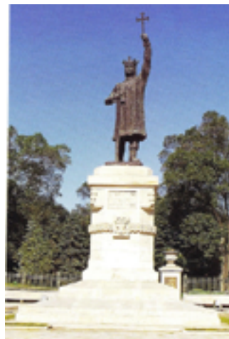
Monumentul lui Ștefan cel Mare realizat de Alexandru Plămădeală în anul 1927.