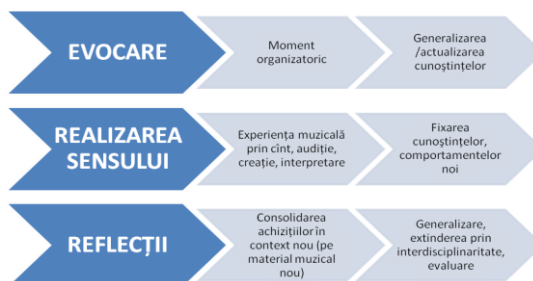
Figura 2. Evenimentele educaționale (etapele) ale lecției

În alegerea variantei de lecție intervin cîteva variabile: poziționarea actului instructiv (începutul/mijlocul/sfîrșitul temei); caracteristicile grupului de elevi (mărimea, omogenitatea, nivelul pre-achizițiilor în domeniul muzicii etc.); recomandările Curriculum-ului disciplinar; gradul de asigurare informațională (material muzical, material teoretic, suport intuitiv video, acces la internet etc.; stilul de predare a profesorului etc. Evenimentele educaționale dintr-o lecție tradițională (captarea atenției, reactualizarea achizițiilor anterioare, transmiterea conținuturilor noi, dirijarea învățării (fixarea/consolidarea), realizarea conexiunii inverse (feedback-ul), concluzii, tema pe acasă, evaluarea rezultatului școlar) se restructurează în cadrul unei lecții moderne în trei etape: evocare, realizarea sensului, reflecții.