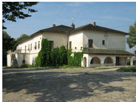
Conacul stolnicului Constantin Cantacuzino