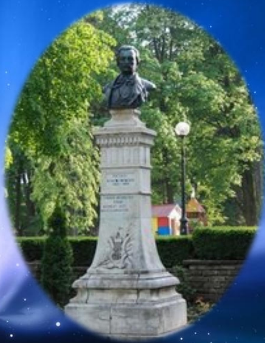
Eminescu - sculptor Ion Georgescu, bust amplasat în 1890 în fața școlii Marchian Botoșani. Azi, în Parcul M. Eminescu.