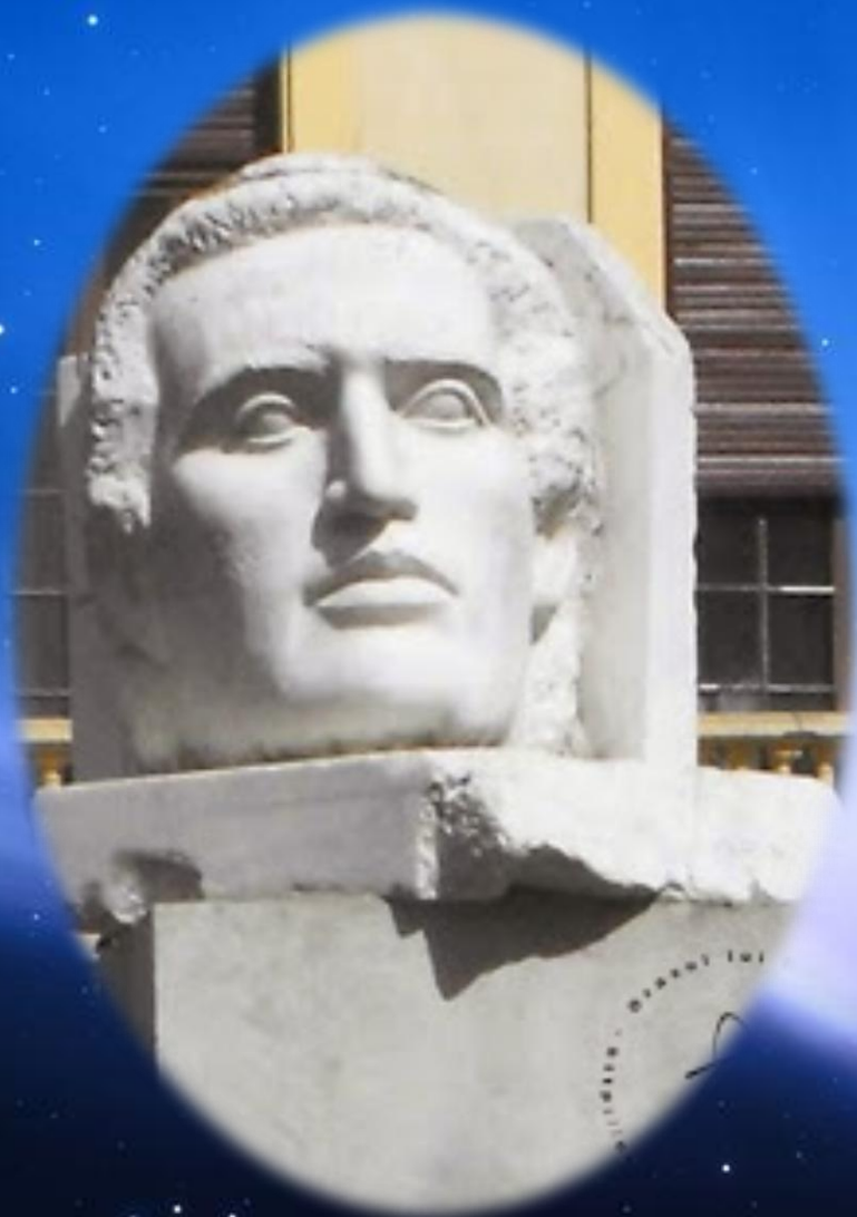
Curtea sediului PSD din Șos. Kiseleff, bustul poetului național de Doru Drăgușin, montat în 2001.