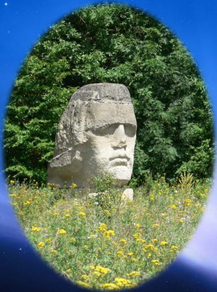
Eminescu, Poiana cu schit (pădurea Bîrnova, de lângă Iași), autor Dan Covătaru.