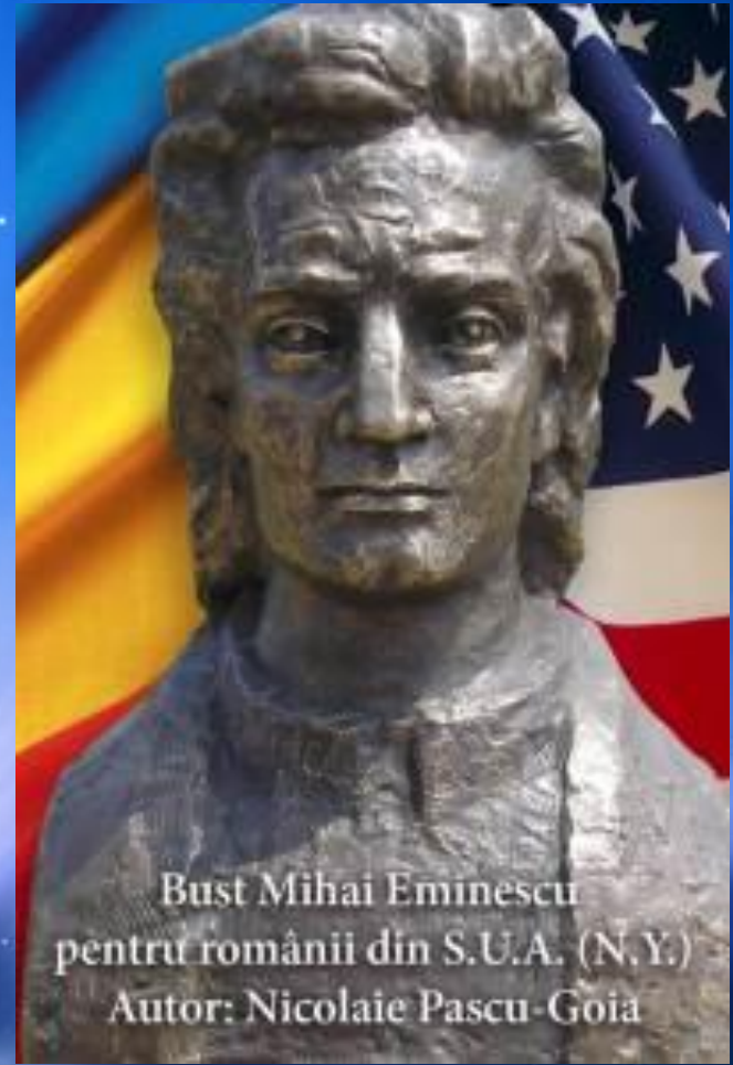
Bust Mihai Eminescu pentru românii din S.U.A. (N.Y.) Autor: Nicolaie Pascu-Goia