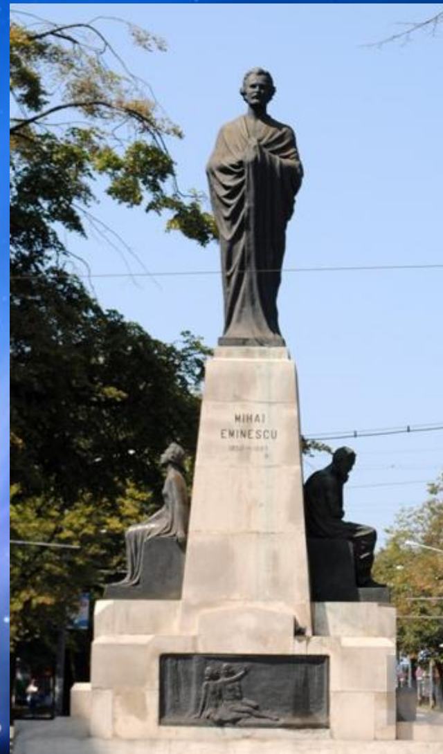
Statuia lui Mihai Eminescu din Iași, monument din bronz închinat „Luceafărului poeziei românești”, realizat de sculptorul Ion Schmidt Faur și inaugurat în anul 1929.