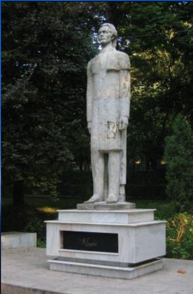
Statuie Eminescu – Deva, autor Tudor Panait (1970).