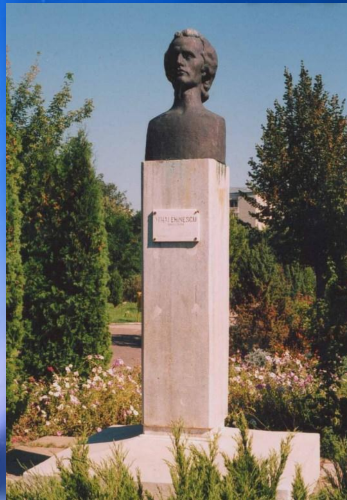
Bust Eminescu – Bârlad, autor Ion Irimescu (1994).