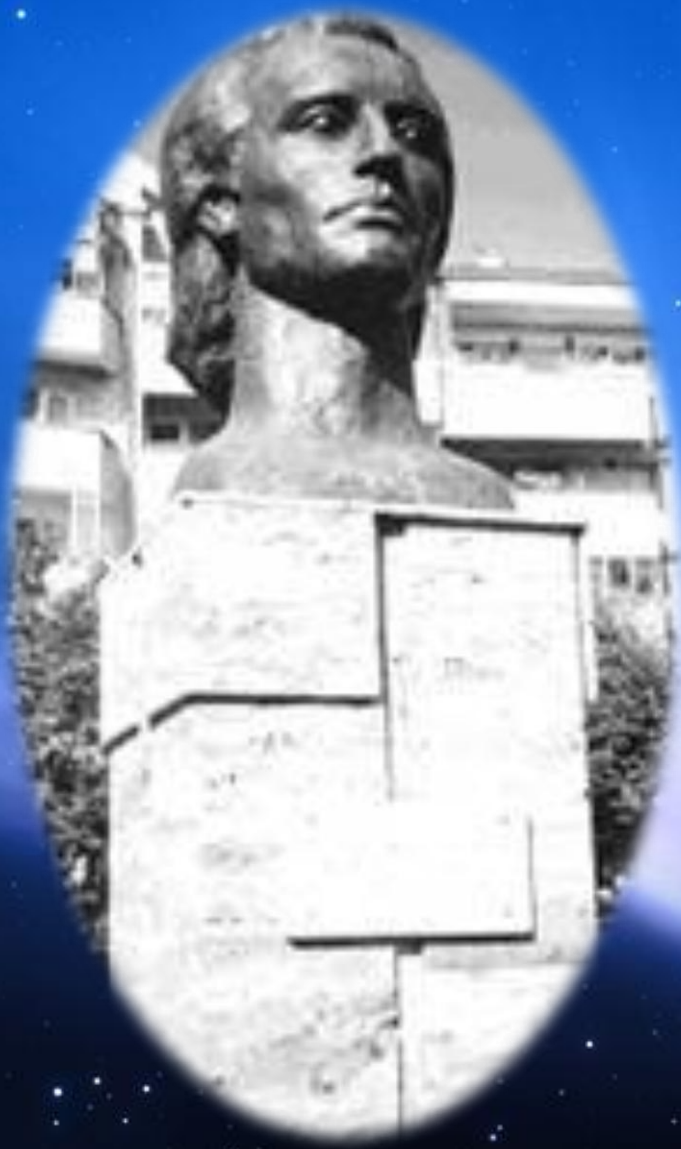
Eminescu - sculptor Dumitru Pasima. Casa Tineretului Botoșani, 2001.