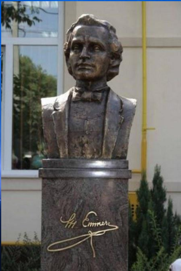
Monumentul Mihai Eminescu de la Dumbrăvița (Timiș) 2009.