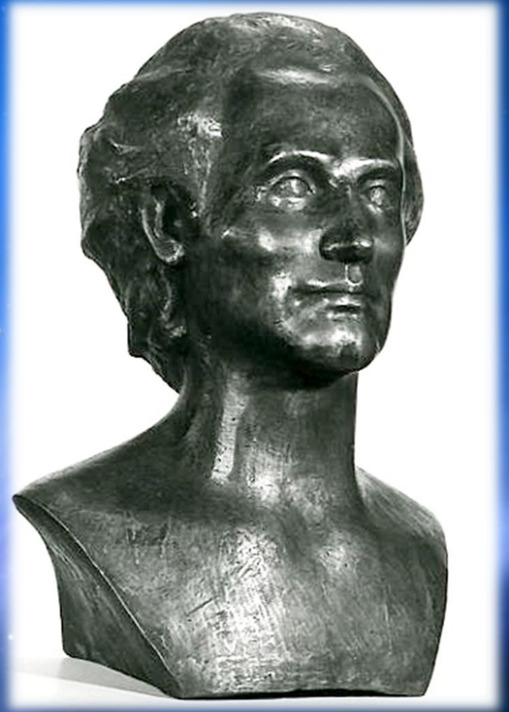
Eminescu – bronz, autor Vasile Gorduz.

“Eminescu”, bust din colecția Sanda Dunca, semnat Alexandru Pană.