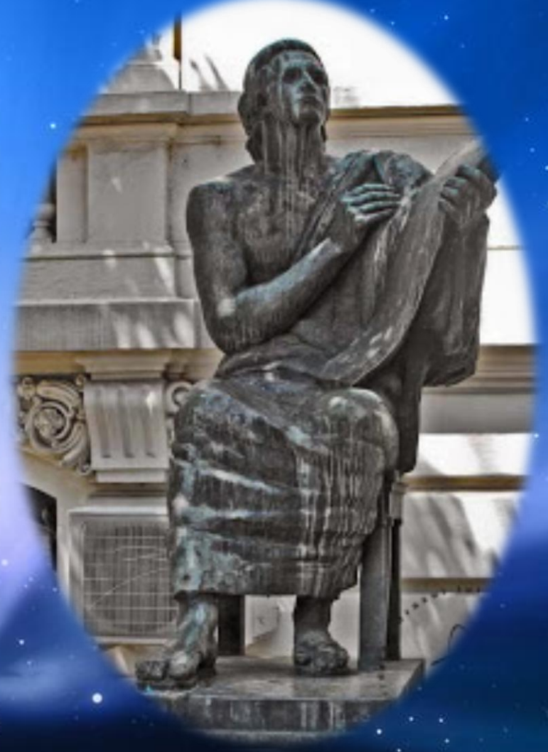
Curtea Ministerului Afacerilor Externe, București, statuia lui Eminescu din bronz, opera sculptorului Ion Jalea.