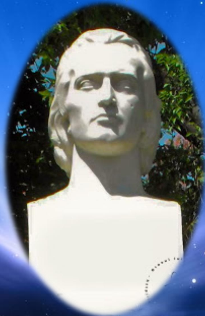
Parcul Cișmigiu, bustul din marmură a lui M. Eminescu în cadrul ansamblului Rotondei scriitorilor, autor Ion Jalea, montat în anul 1943.