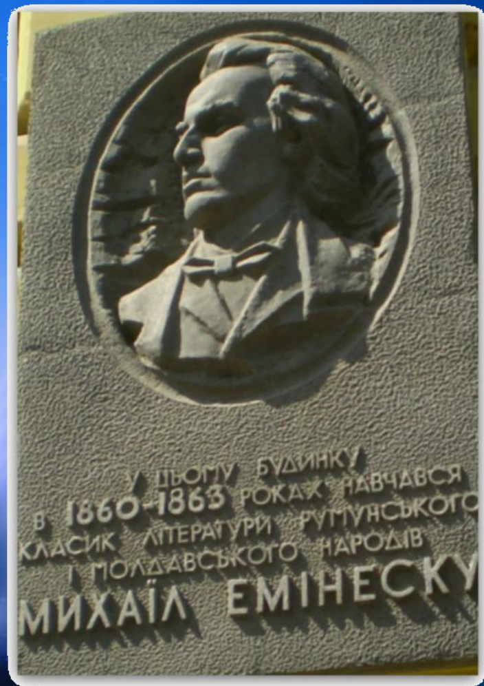
Placă memorială „Mihai Eminescu”, Cernăuți.