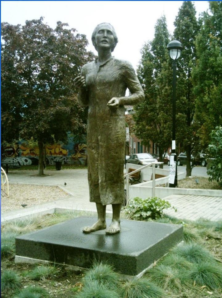
Romania Square, Montreal, sculptor Vasile Gorduz, 2004.