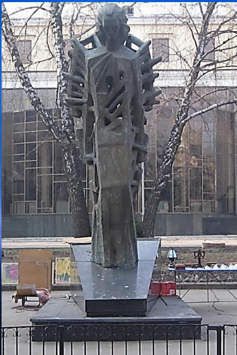
„Luceafărul”, sculptat de Tudor Cataraga, Anii 90