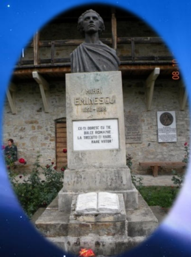
Bustul lui Eminescu de la Mănăstirea Putna.