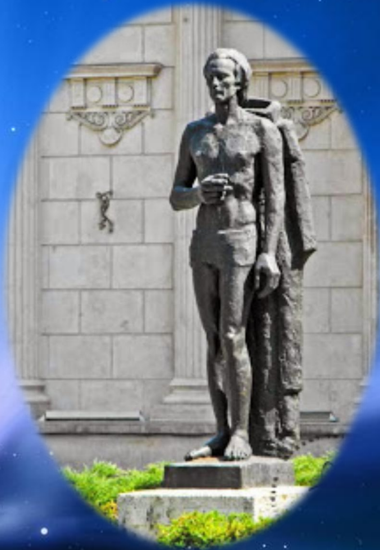
În fața Ateneului Român statuia din bronz a lui M. Eminescu, opera sculptorului Gheorghe Anghele, montată în anul 1965.