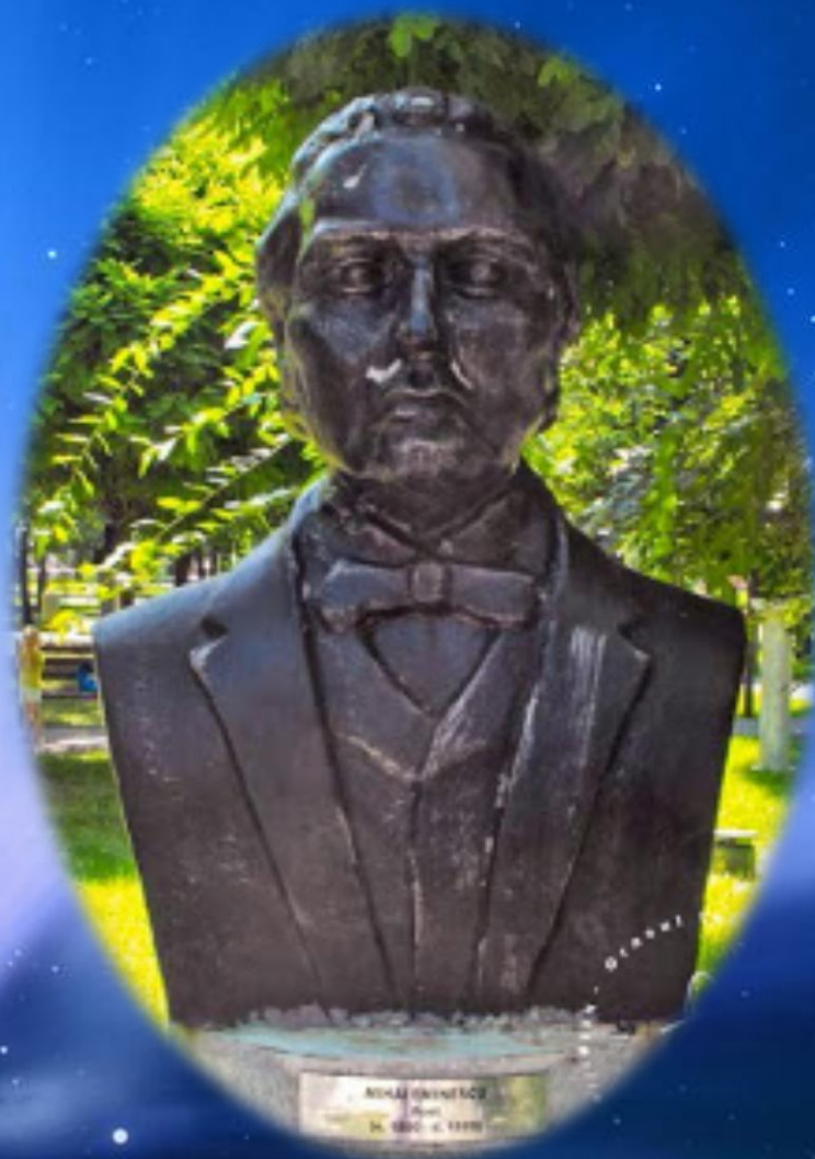
Ansamblul „Grădina valorilor românești” din parcul „Lumea copiilor”. Bustul poetului, întregul ansamblu fiind inaugurat în 2010.