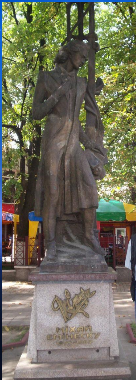
Statuia lui Eminescu – Cernăuți, sculptor Marcel Guguianu.