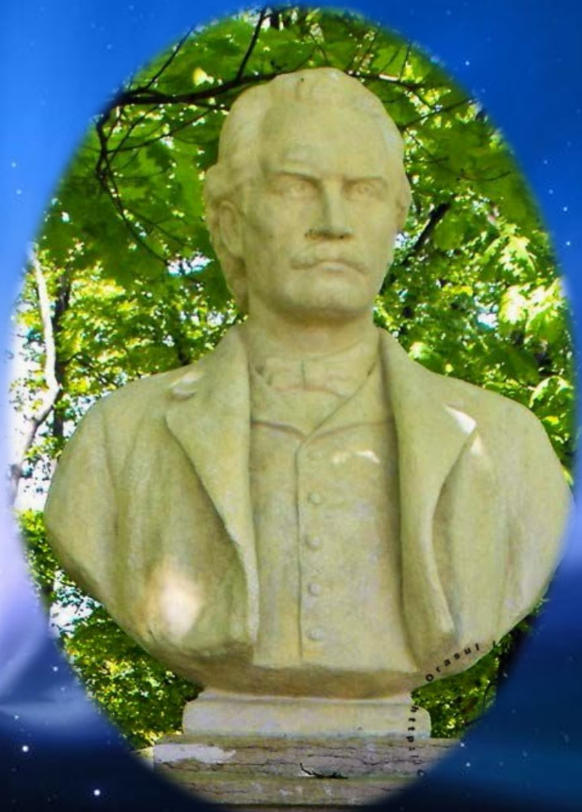
Statuia lui Eminescu din Parcul Herăstrău, opera sculptorului Mihai Onofrei, montat în anul 1953.