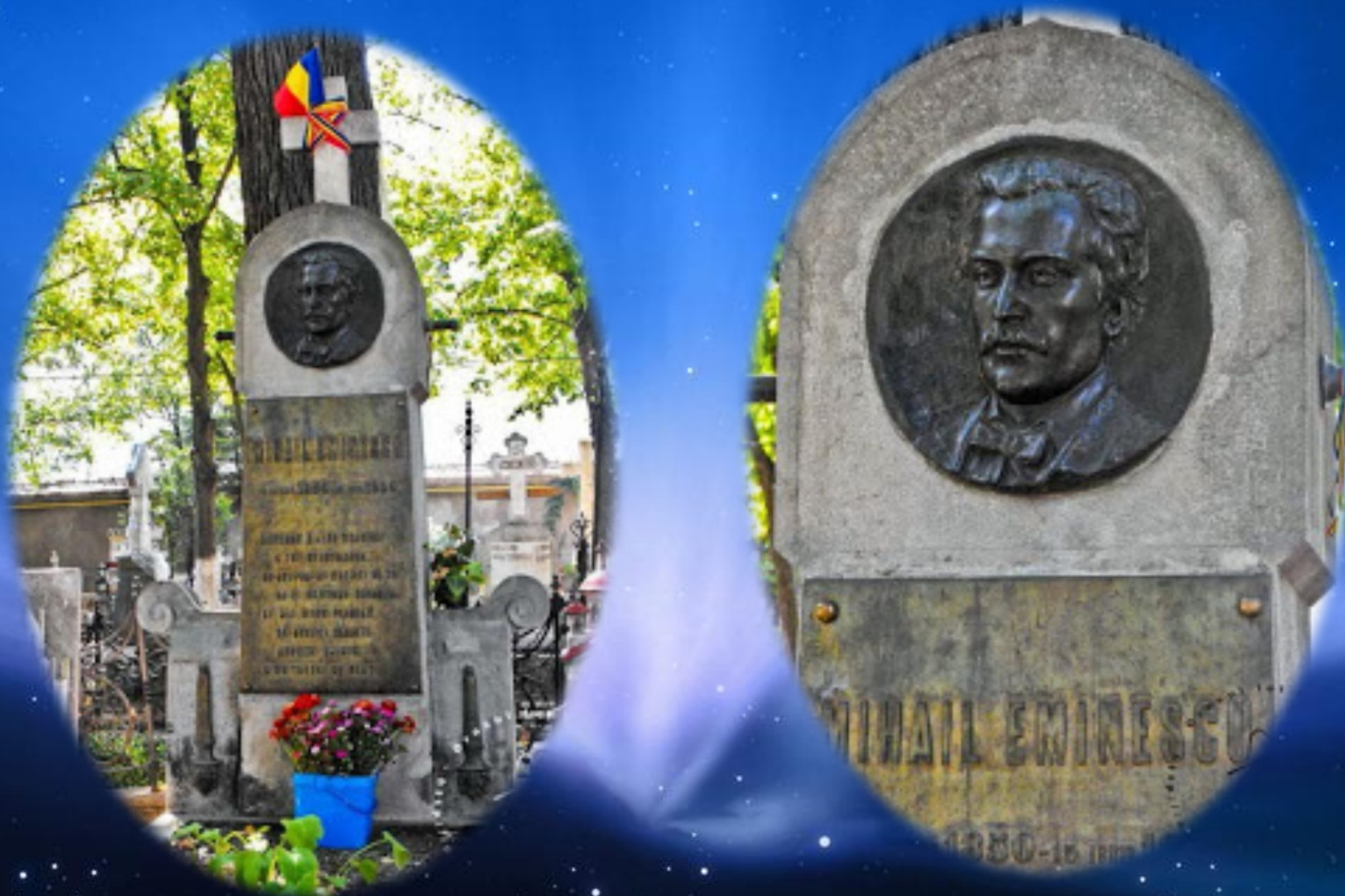
Medalioniul montat pe mormântul lui Mihai Eminescu din Cimitirul Belu, opera lui Ioan Georgescu.