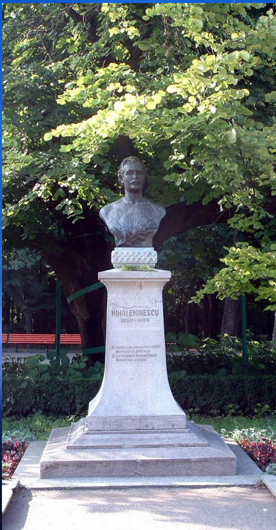
Statuia lui Mihai Eminescu. Parcul Copou din Iași..