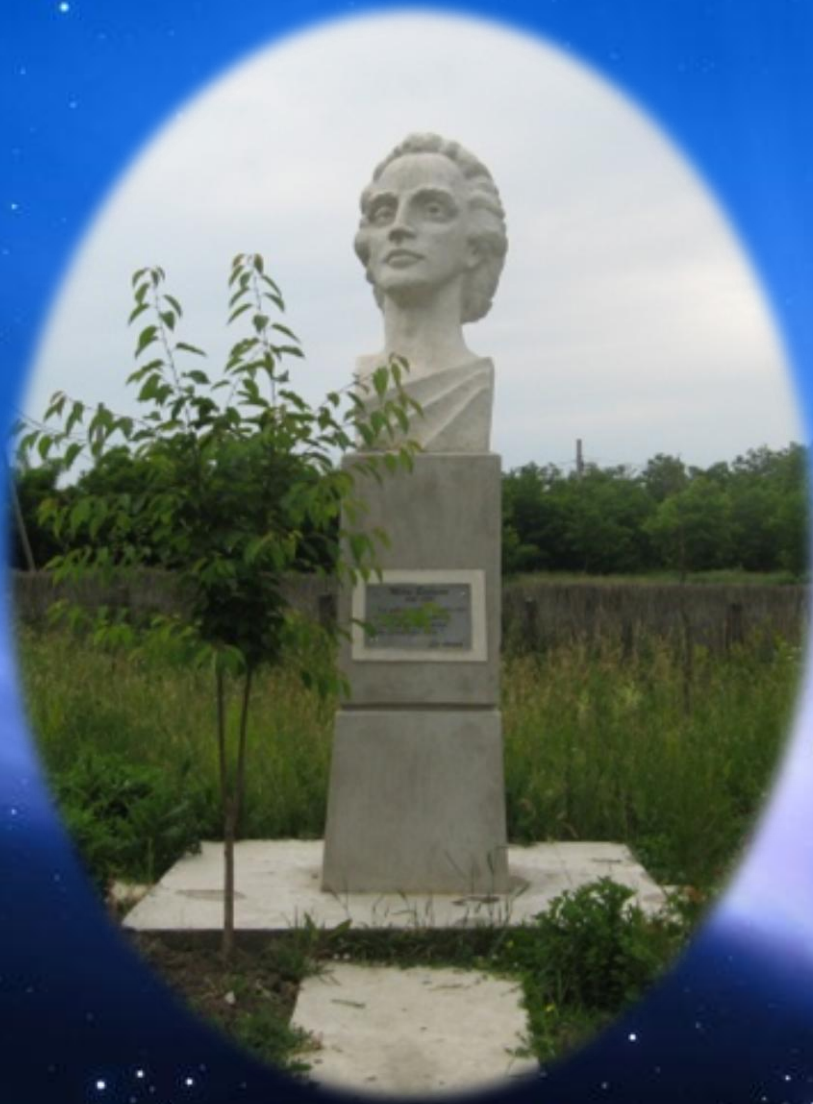
Eminescu - sculptor Victor Foca, inaugurat în anul 2005.