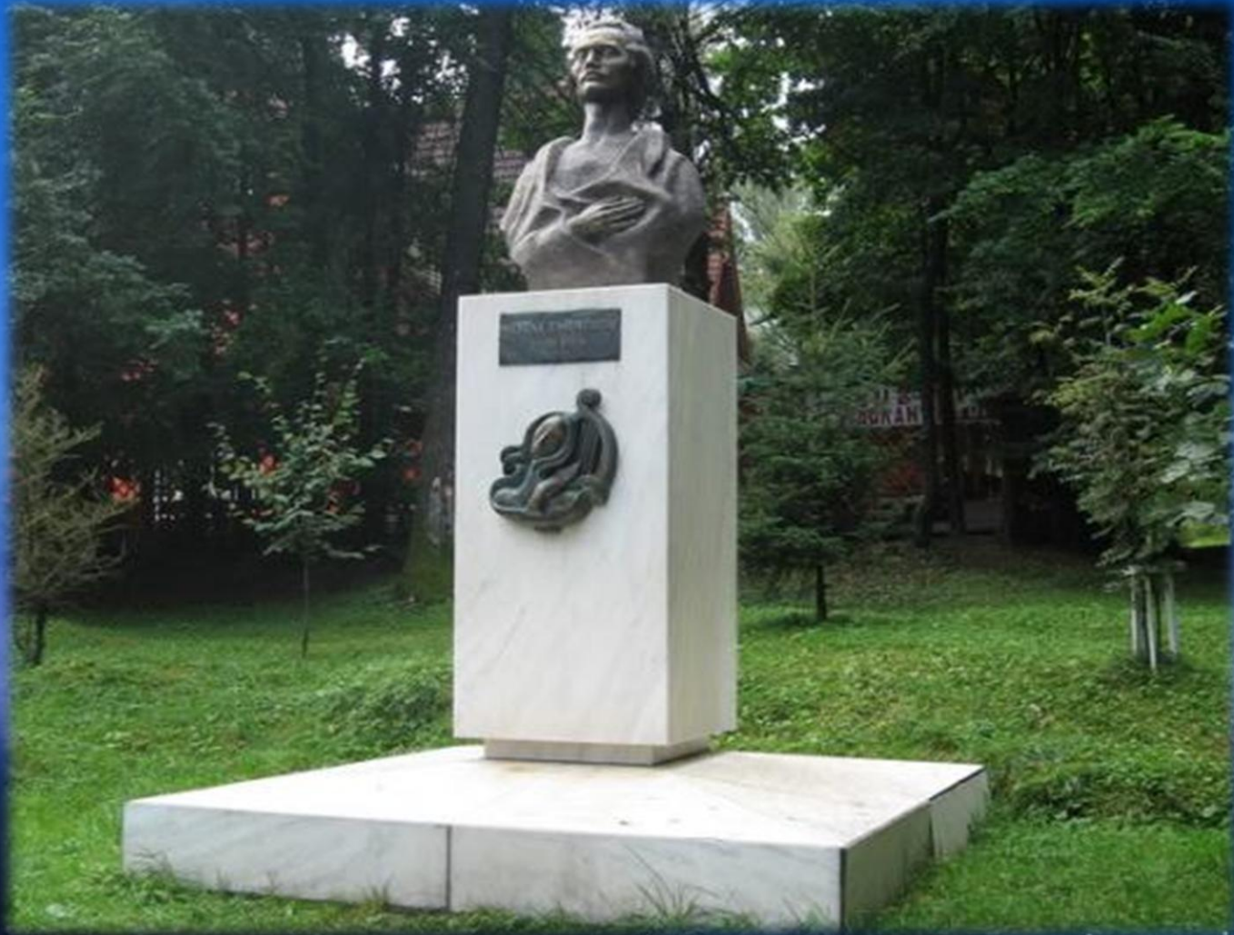
Bustul lui Eminescu de la Vatra Dornei