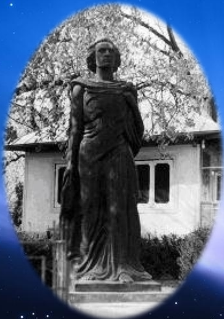
Eminescu - sculptor Oscar Han. Biserica Uspenia Botoşani.