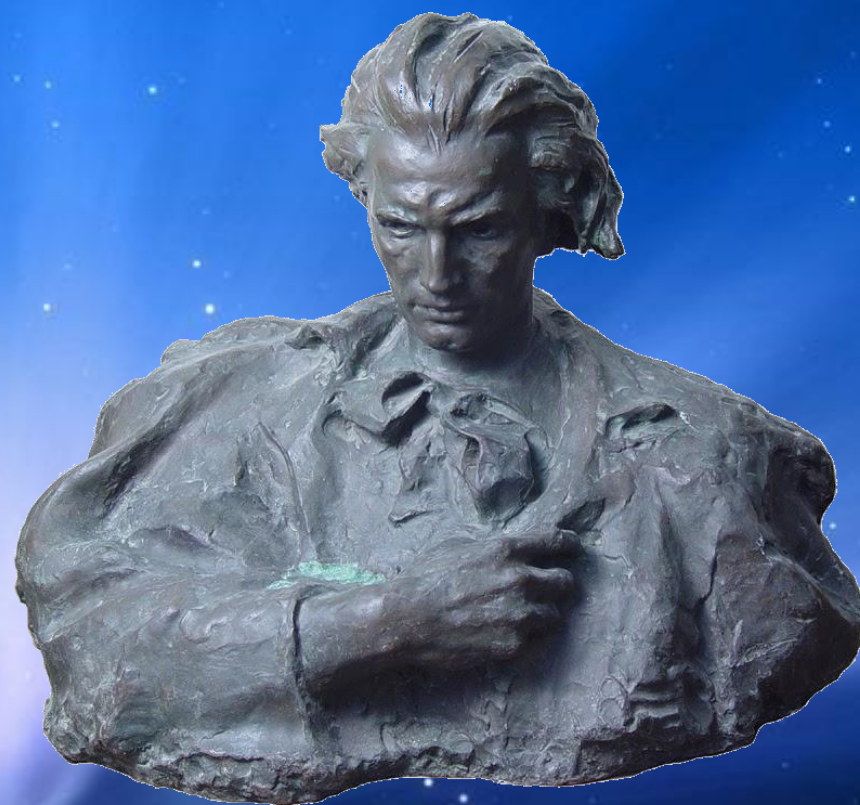
Lazar Dubinovschi - Mihai Eminescu, bronz.