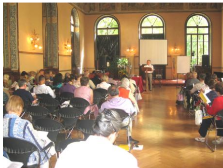
Discursul autorului la Congres