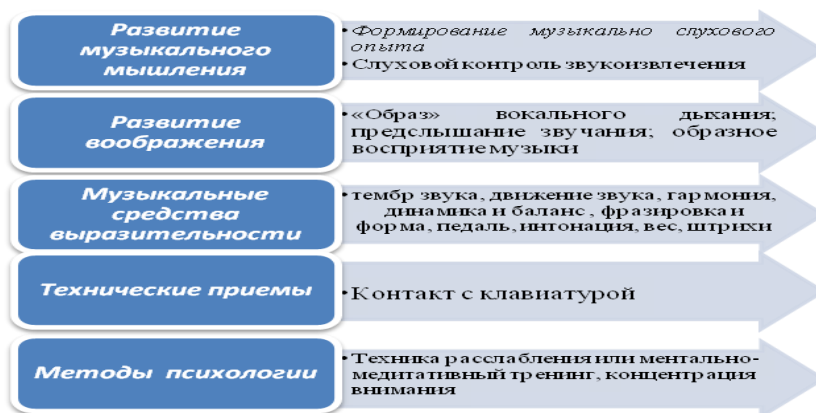
Рис. 1 Методология работы над художественным звукоизвлечением

Разработанная нами схема-модель методологии работы над художественным звукоизвлечением, предполагает планомерное развитие музыкального мышления учащегося . Но, прежде всего, ученикам следует накапливать музыкально-слуховой опыт как основу исполнительского творчества. В этом случае вспоминается высказывание Г. Г. Нейгауза о том, что «Прежде чем начать учиться на каком бы то ни было инструменте, обучающийся [...] должен духовно владеть какой-то музыкой: так сказать, хранить ее в своем уме, носить в своей душе и слышать своим слухом» [1, стр. 11].